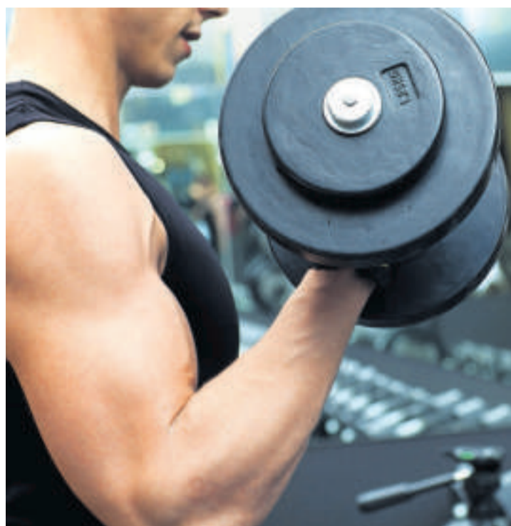
Die Substanz Androstendion führt zu sichtbarem Muskelzuwachs.

Weder die Schweizer Firma noch ihr Chef verfügten allerdings über eine solche Bewilligung. Aus diesem Grund hat das Schweizerische Heilmittelinstitut Swissmedic im August 2013 ein Strafverfahren gegen die Firmenverantwortlichen eröffnet, wie Swissmedic-Sprecher Lukas Jaggi sagt. Drei Tage nach der Eröffnung des Verfahrens führte die Behörde in zwei Liegenschaften Hausdurchsuchungen durch und stellte zahlreiches Material sicher. Ob dabei auch die 3000 Kilogramm Androstendion be-