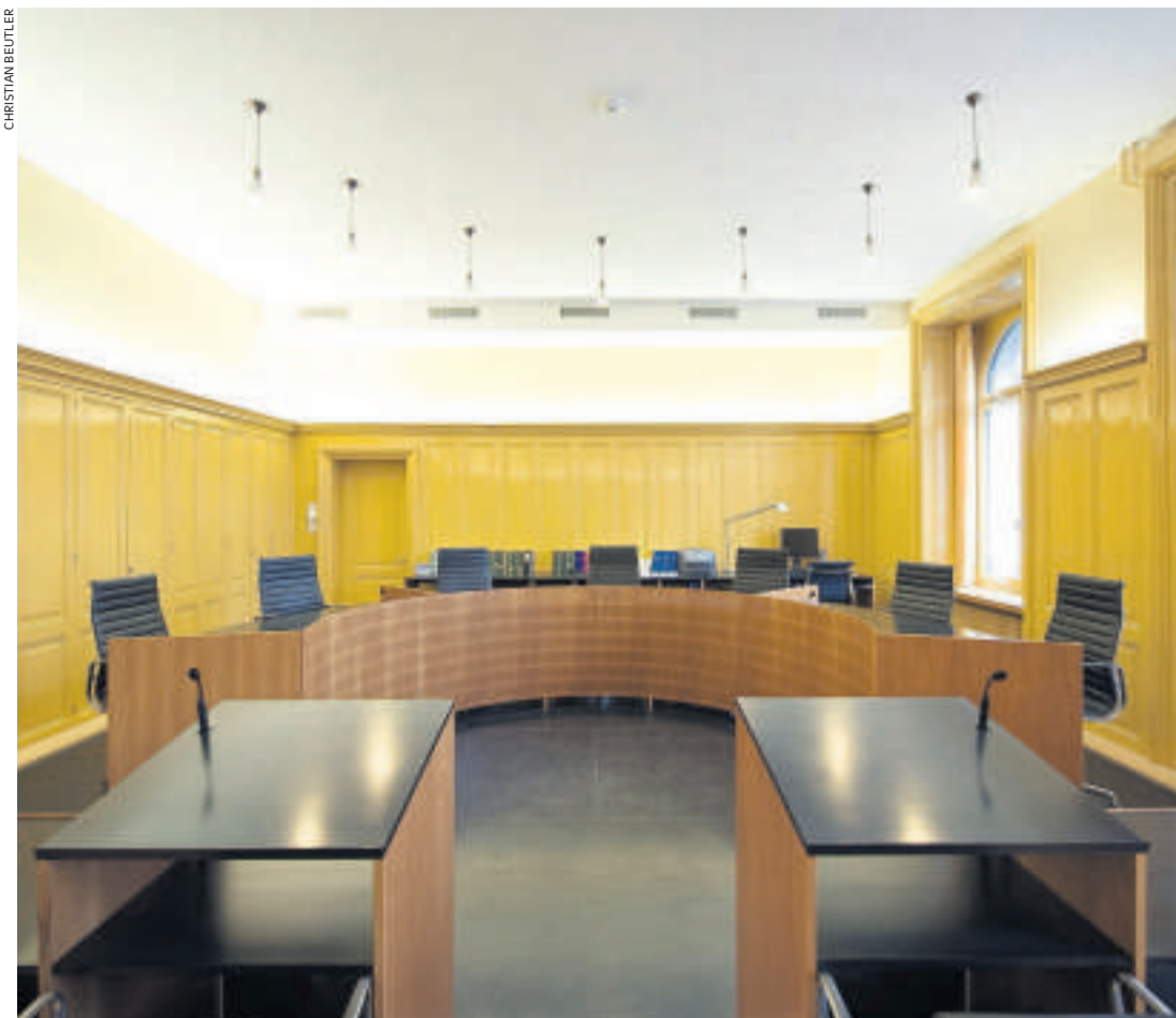
Die Kommunikation beeinflusst den Ruf eines Gerichts: Bezirksgericht Winterthur.